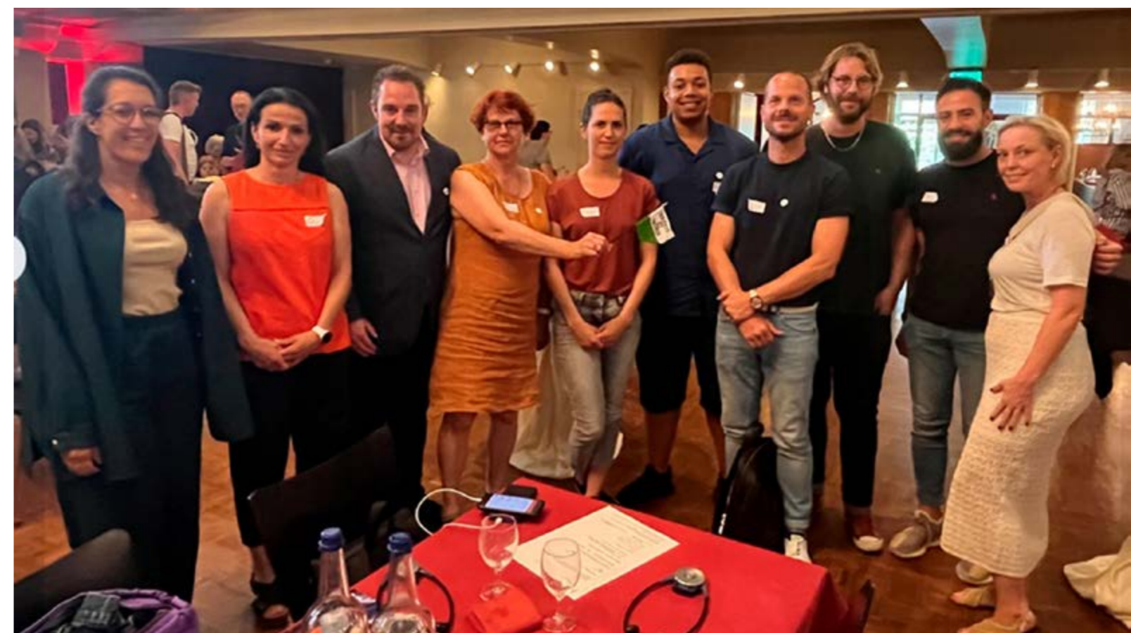
(Assemblée des délégué.e.s 2023)