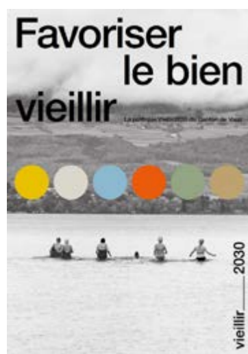
Publication Favoriser le bien vieillir Etat de Vaud

Vous trouverez des plus amples informations sur le site internet de l'Etat de Vaud.